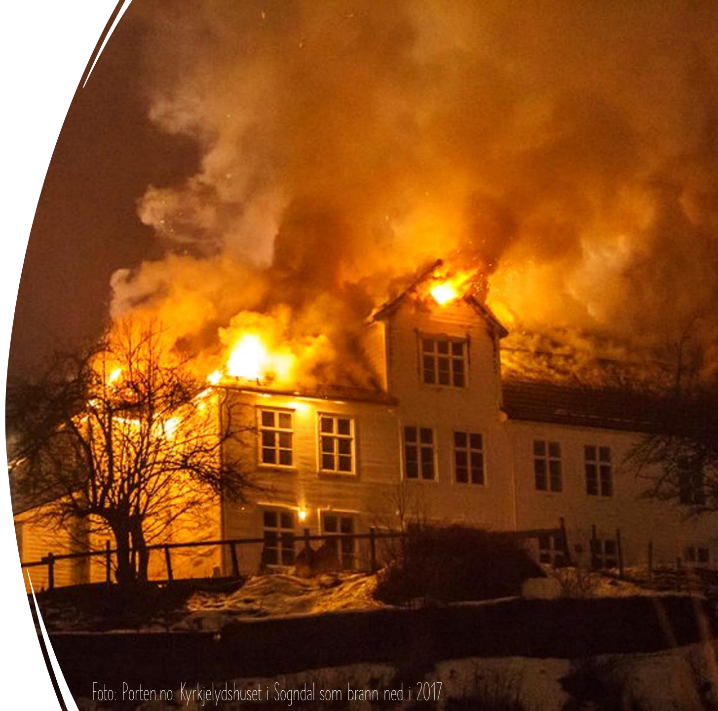
Kyrkjelydshuset i Sogndal som brann ned i 2017.

Frivillige tar på seg et stort ansvar på vegne av fellesskapet, da må vi også gi de gode rammevilkår!