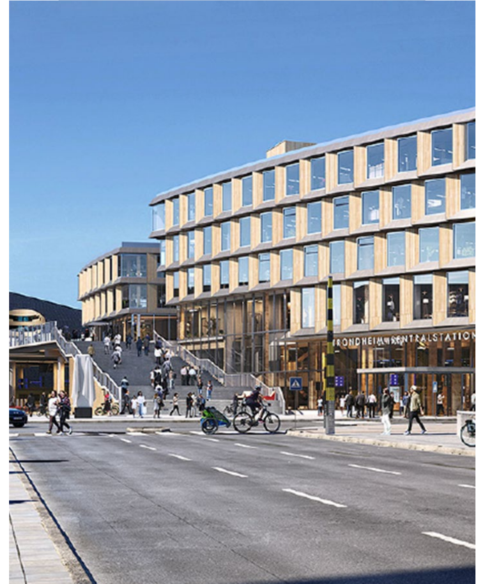
Illustrasjon: Bane NOR Eiendom