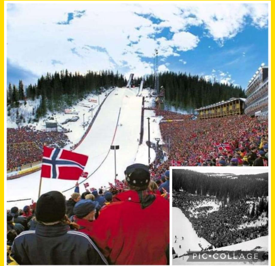
Granåsen VM 1997 og NM 1953