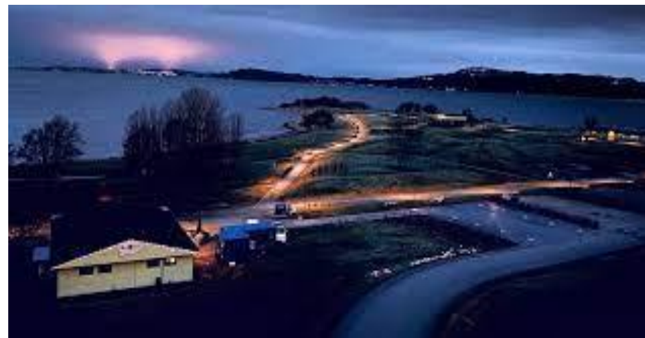
Midsandtangen, foto Malvik kommune

Mange attraktive friluftslivsområder har også store naturkvaliteter som ivaretas for all framtid gjennom sikring.