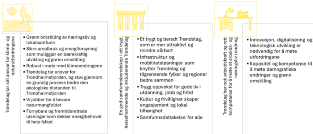
Figur 1: Langsiktig utviklingsmål og hovedmål fra gjeldende regional planstrategi (2024)