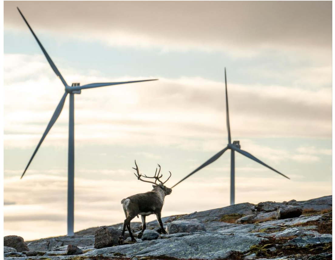
Heiko Junge, NTB