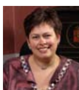
Rita Ottervik Ordfører Trondheim