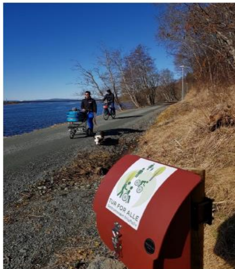
Elvegropromenaden langs Verdalselva, med ES-Sirua i bakgrunnen (Verdal kommune).