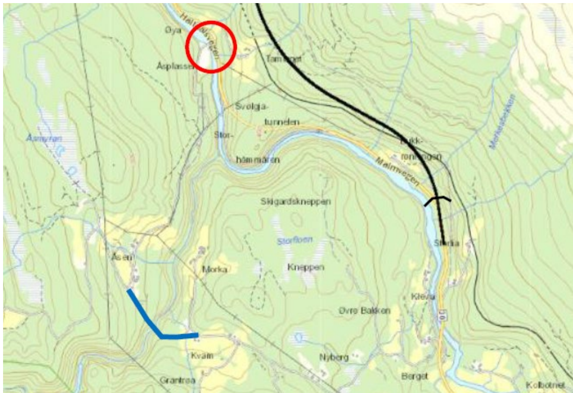
Figur 3: mulig tilkobling Åsvegen (alt. 10)

Ved bygging av alt. 10 må enten deler av eksisterende fv. 30 holdes åpen (med behov for rassikring) eller det må bygges ny bru og tilkobling til Morkavegen (blå strek nedenfor).