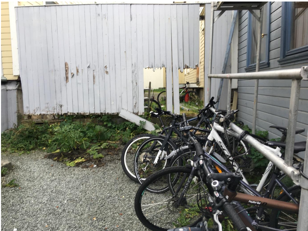
Bakgård i utleiebolig med fraværende eier.

Denne konsentrasjonen av studenter (og annen ungdom) i egne bygårder har ført til en dramatisk forringelse av betydelige deler av bomiljøet på Møllenberg. Det er høsten 2021 dokumentert at utagerende festing/rusbruk blant studentene har skapt uutholdelige forhold for mange av de øvrige beboerne. I tillegg kommer det faktum at denne sterke konsentrasjonen av utleieboliger for studenter i betydelig grad har forslummet det fysiske miljøet. Slitasjen på bygningsmassen er stor, vedlikehold mangler, og i bakgårdene hopper det seg opp skrot, sykler og kasserte møbler som ingen lenger tar ansvar for.